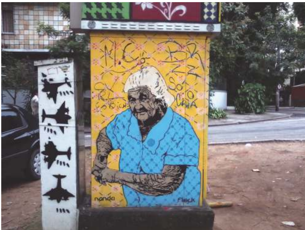
PIXAÇÃO E STENCIL, GRAJAÚ, ZONA NORTE