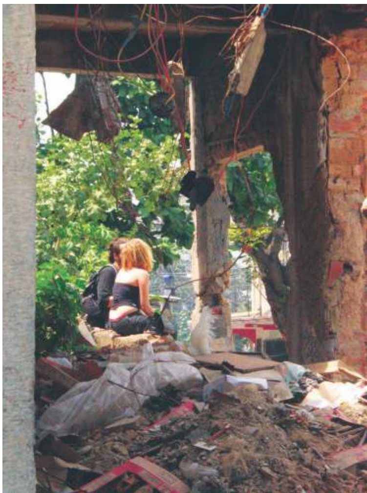
METALEIROS AMANHECENDO NA V.M., SÃO FRANCISCO XAVIER, ZONA NORTE