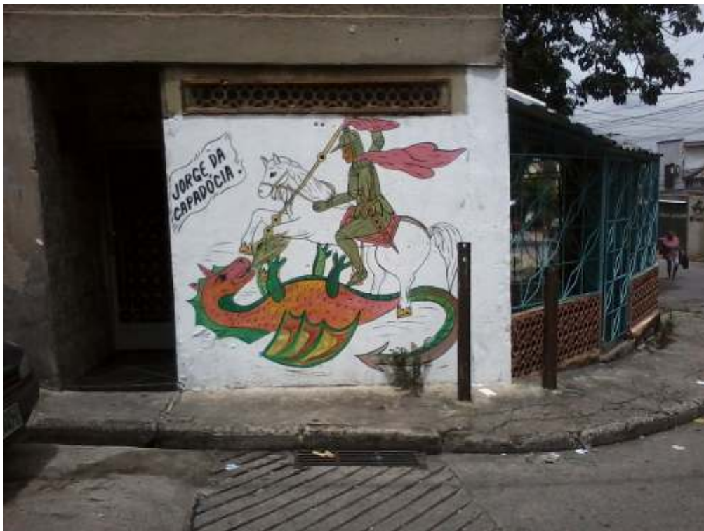
MURAL DE JORGE DA CAPADÓCIA EM CACHAMBI, ZONA NORTE