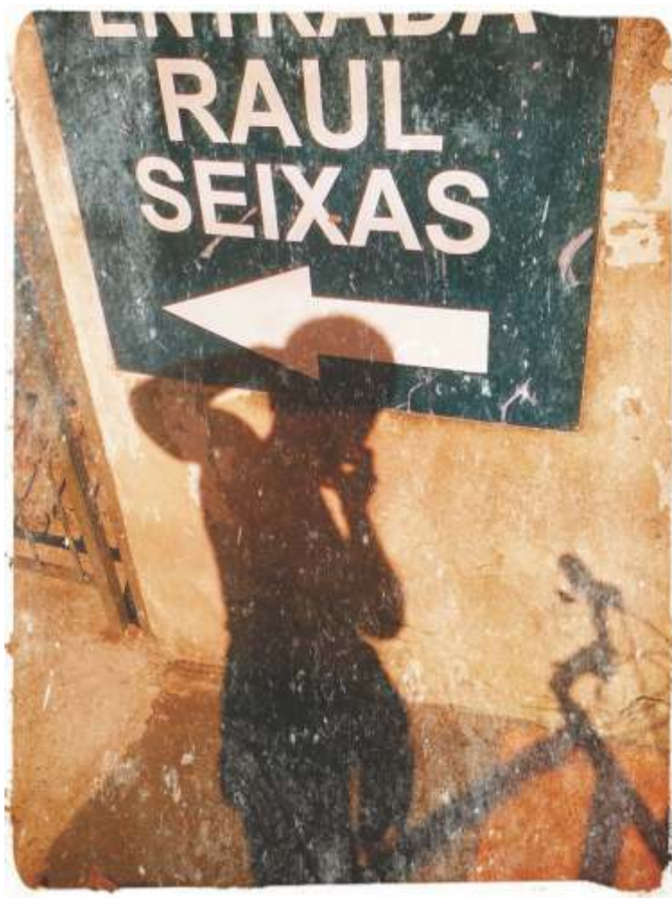
UMA DAS ENTRADAS DO CENTRO DE ATENÇÃO PSICOSSOCIAL NISE DA SILVEIRA, NO ENGENHO DE DENTRO