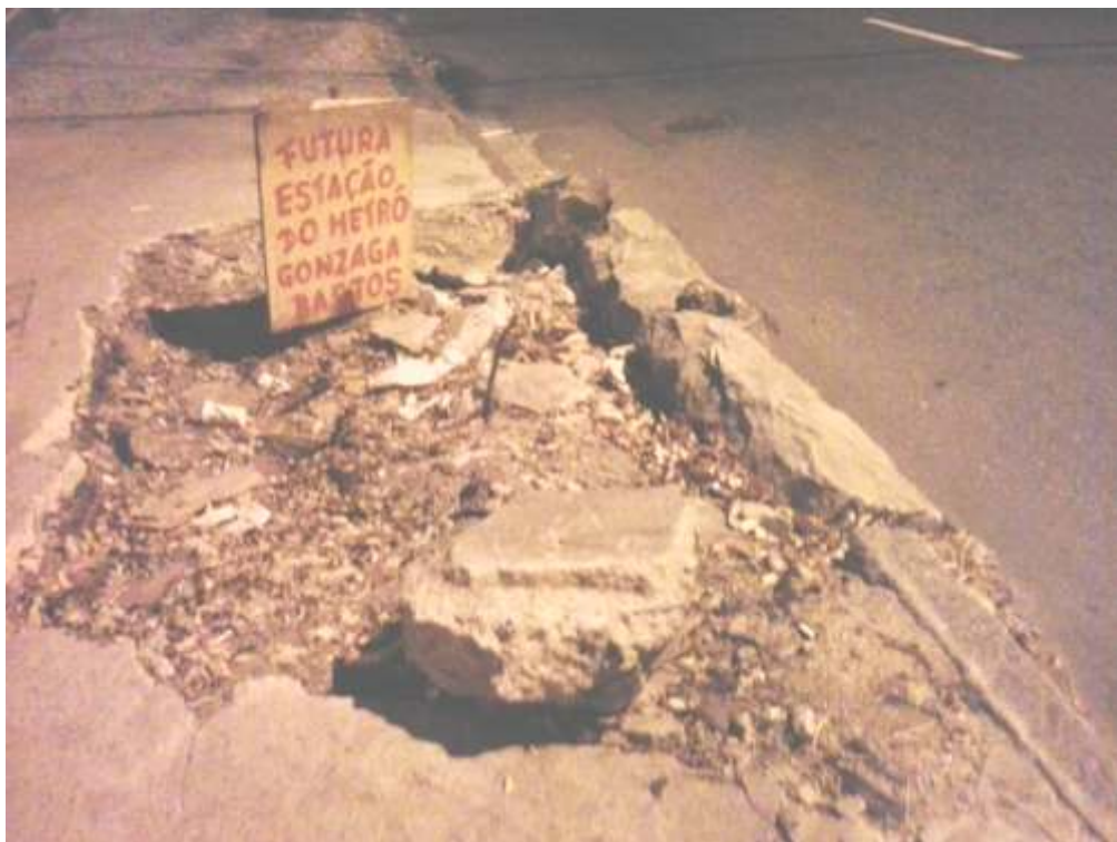
RUA GONZAGA BASTOS, ANDARAÍ, ZONA NORTE