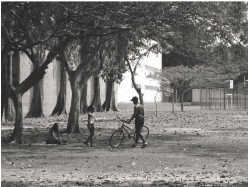
QUINTA DA BOA VISTA, SÃO CRISTÓVÃO, ZONA NORTE