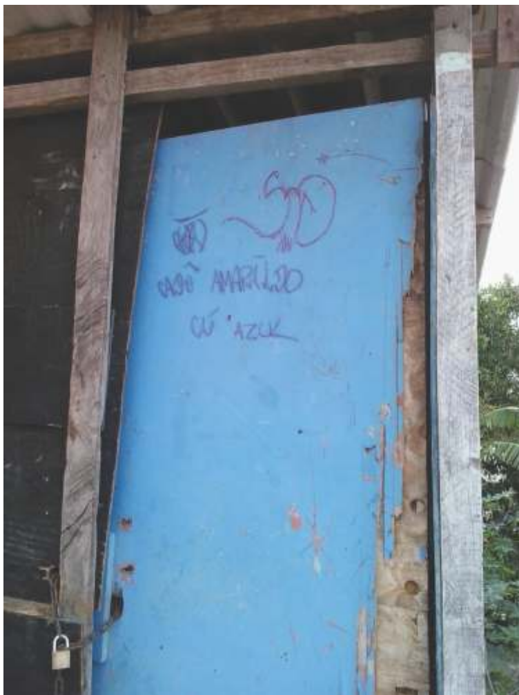
'CADE O AMARILLO?', COMPLEXO DO ALEMÃO, ZONA NORTE