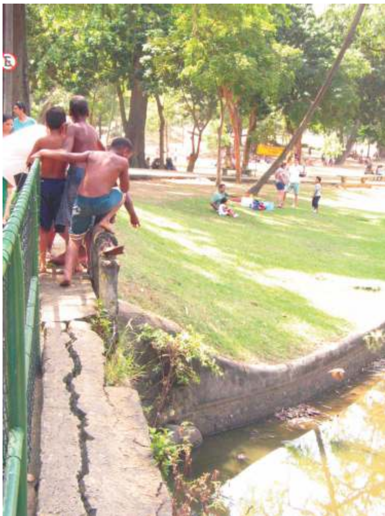
QUINTA DA BOA VISTA, SÃO CRISTÓVÃO, ZONA NORTE