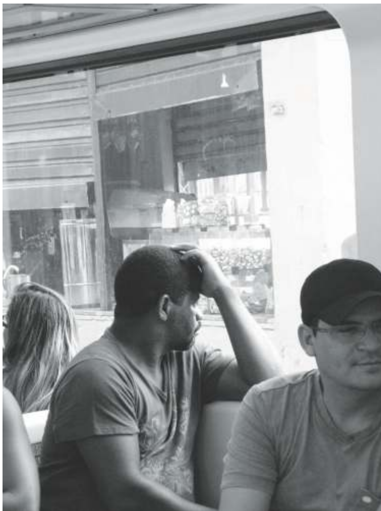
NO MESMO VAGÃO DA SUPERVIA, ZONA NORTE