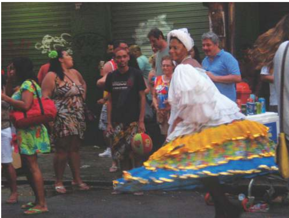
BAIANA NO BLOCO DA HADDOCK, TIJUCA, ZONA NORTE