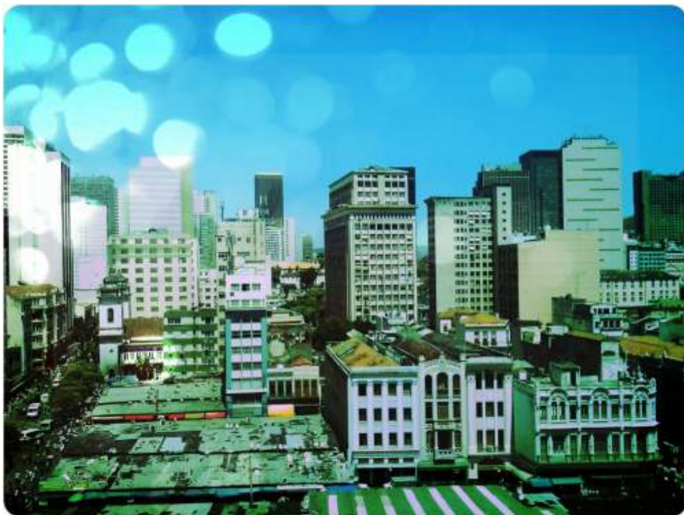
VISTA DE CIMA DO CAMELÓDROMO DA URUGUAIANA, CENTRO DA CIDADE