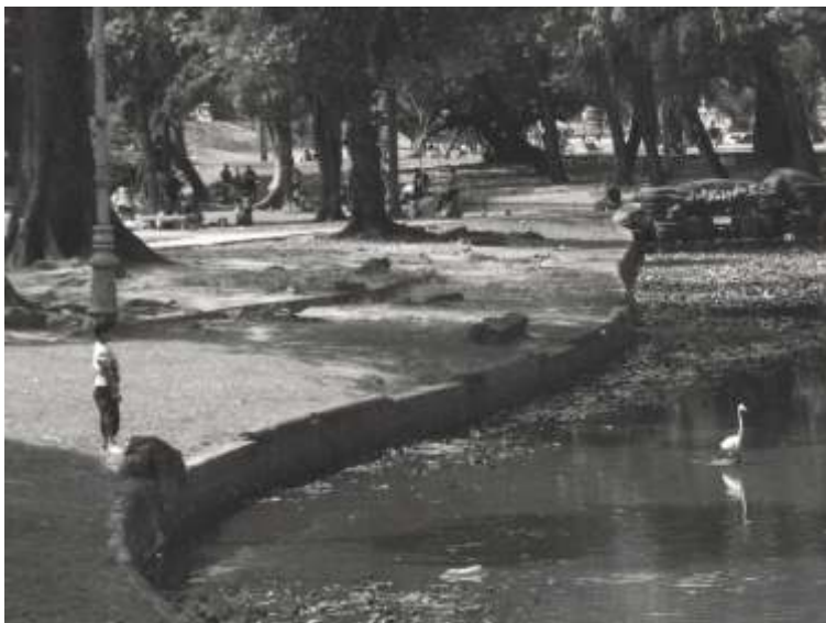
O MENINO OLHANDO A GARÇA, A GARÇA OLHANDO O MENINO, QUINTA DA BOA VISTA, SÃO CRISTÓVÃO, ZONA NORTE