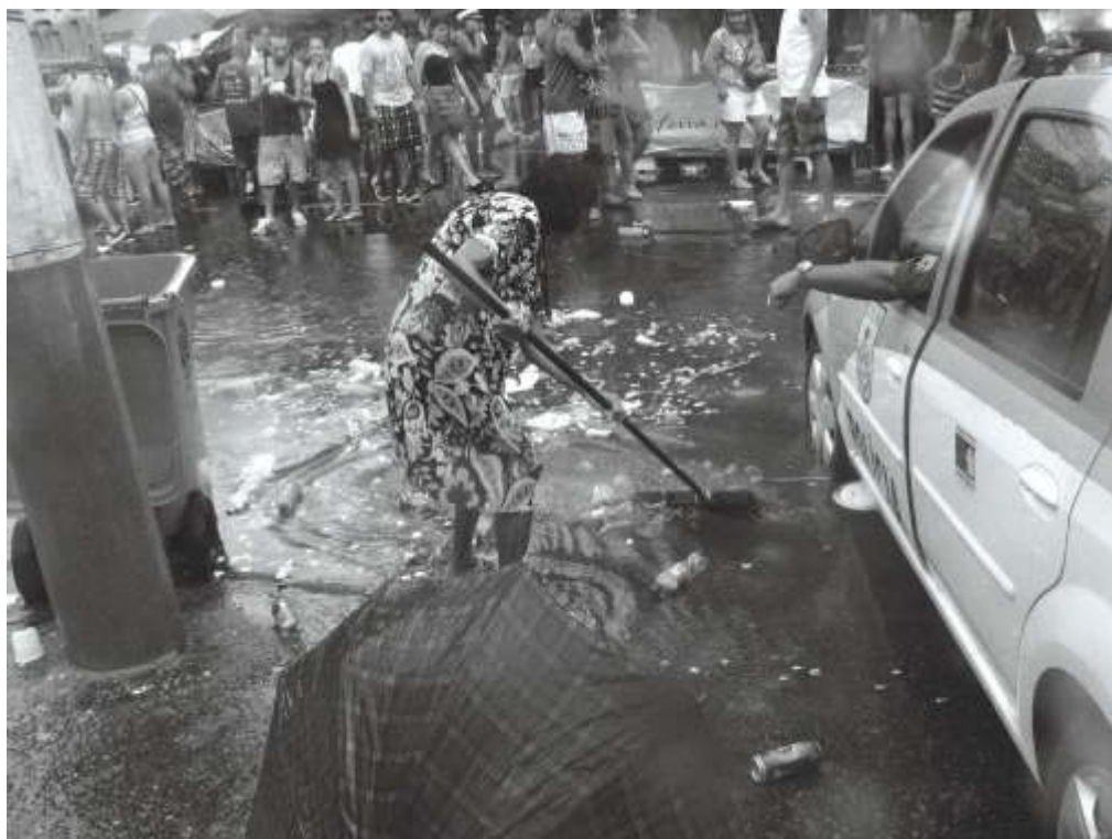
SISTEMA DE ESCOAMENTO DE ÁGUA, BLOCO ROSA DE OURO, MADUREIRA, ZONA NORTE