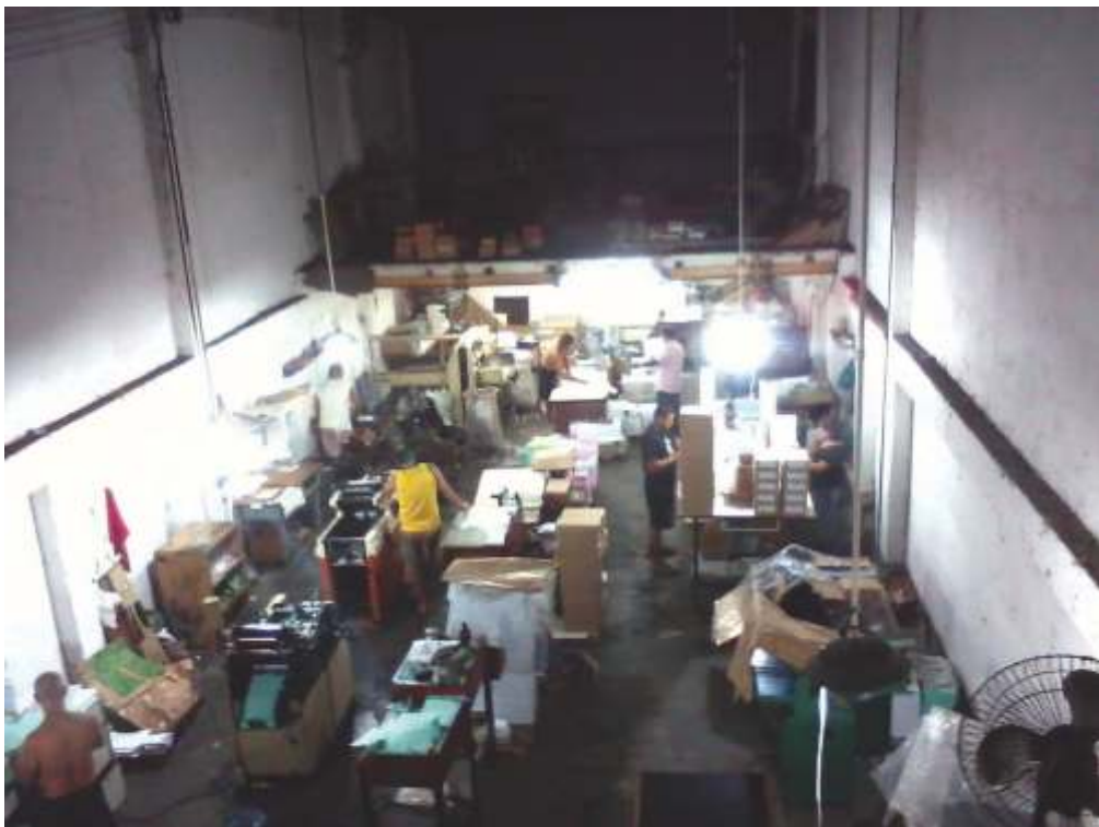
IMPRESSÃO + ACABAMENTO GRÁFICO, SAÚDE, ZONA PORTUÁRIA