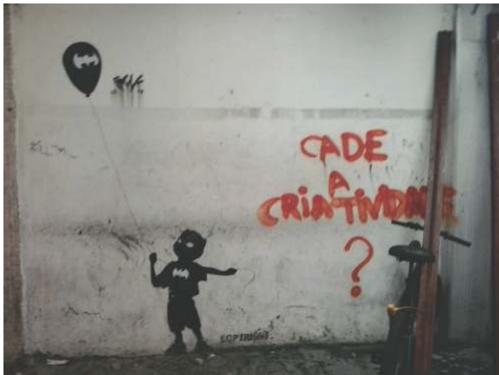
PIXAÇÃO EM COPACABANA, PERTO DA SIQUEIRA CAMPOS